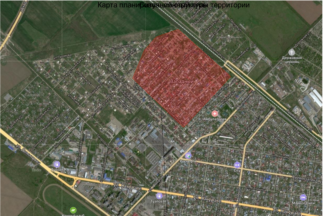
Граница проектируемой территории